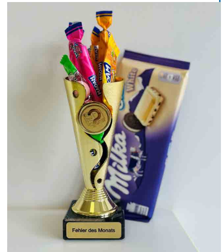
Wanderpokal für den Fehler des Monats

darauf, wie wir es in Zukunft besser machen können. In der nächsten Teamsitzung wird der Fehler des Monats bzw. das verantwortliche Teammitglied gekürt und bekommt neben dem Pokal auch eine Urkunde. Ein Duplikat davon hängen wir in unserer Fehlergalerie auf. Dabei wird wieder betont, was wir aus diesem Fehler gelernt haben und vor allem, wie wir es zukünftig besser machen wollen. Teilweise wird hierzu auch im gesamten Team nach Ideen und Anregungen geforscht. „Was braucht ihr, damit so was (ähnliches) nicht nochmal passiert?“. Und zum Abschluss des Jahres wird der Fehler des Jahres gekürt. Hier winken dem Gewinner bzw. der Gewinnerin nochmal ein ganz besonderer Preis.